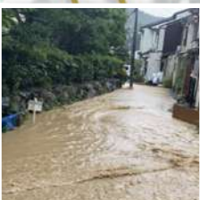
御陵山ノ谷、日ノ岡堤谷町(旧安祥寺川)