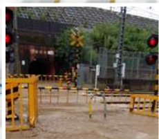
御陵別所町、天徳町付近