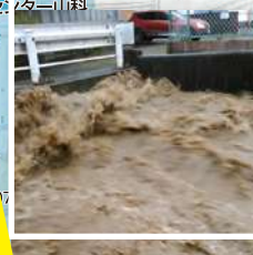
四ノ宮神田町付近(四宮川)