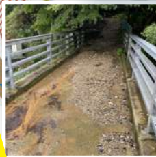
山科音羽川(中島橋)