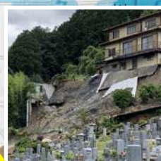
西野山桜ノ馬場町付近