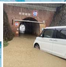
御陵田山町(安祥寺川)